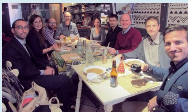
✓ Slika 2. Zajednički ručak sudionika projekta

Svi su se sudionici sastanka složili kako ih veseli što njihove organizacije sudjeluju u projektu te kako ga vide kao izvrsnu priliku za profesionalni, ali i osobni razvoj, razvijanje novih vještina te povezivanje s drugim članicama Europske unije. Sastanak je zaključen zajedničkim objedom u restoranu koji uspješno provodi politiku socijalnog poduzetništva na način da na kraći rok zapošljava migrante.