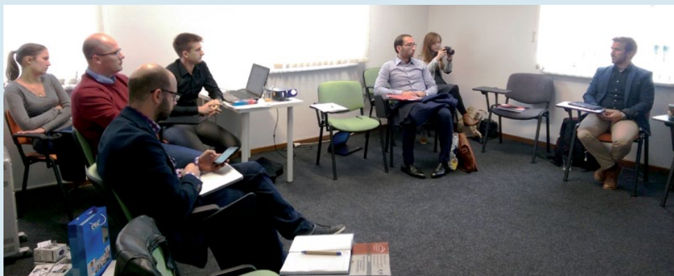
✓ Slika 1. Radna atmosfera na prvom transnacionalnom sastanku