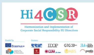
✓ Slika 3. Službeni logo projekta

Dodatne informacije o projektu Hi4CSR doznajte na mrežnoj stranici www.hi4csr.com .